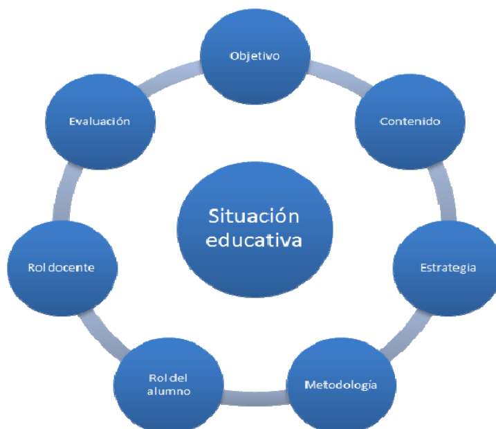
FIGURA 2. COMPONENTES DE LA SITUACIÓN EDUCATIVA EN MATEMÁTICAS.

La situación educativa en la que se involucró a los estudiantes de secundaria, con un ambiente de aprendizaje utilizando la técnica POL para desarrollar las competencias matemáticas se esquematiza en la Figura 2: